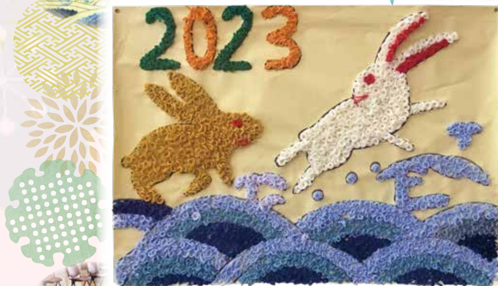
吾郷センターご利用者による作品づくりの光景

干支の卯にちなんで、ご利用者の皆様が壁面飾りを作ってくださいました!ウサギの質感や背景など、毛糸を使って躍動感あふれる飾りができました!